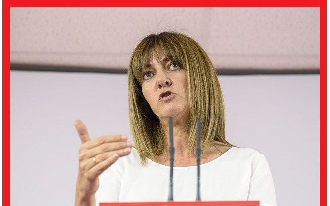
La secretaria general del PSE-EE, Idoia Mencia

La secretaria general del PSE-EE, Idoia Mencia, ha señalado que los socialistas quieren que el anuncio del desarme de ETA vaya acompañado del anuncio de la disolución definitiva de la banda terrorista. Mencia ha comparecido ante los medios de comunicación en el Parlamento Vasco para opinar sobre la intención de ETA de entregar todo su arsenal antes del 8 de abril, según ha informado el diario francés, Le Monde.