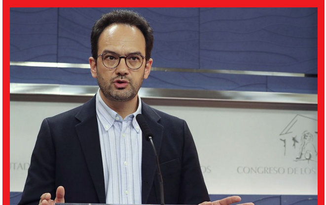
El portavoz del PSOE en el Congreso, Antonio Hernando

El portavoz socialista, Antonio Hernando, hizo, en declaraciones a los periodistas en el Congreso, la siguiente valoración del comunicado de ETA: "El PSOE quiere ser enormemente prudente. Ya en el pasado hemos asistido a informaciones y comunicados relacionados con el desarme de ETA que luego se han frustrado, por lo tanto prudencia por parte del PSOE en relación con esta supuesta información del desarme.