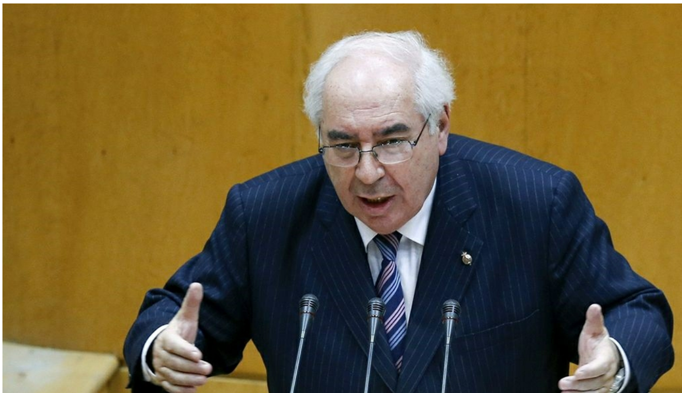
El Portavoz del PSOE en la Cámara Alta, Vicente Álvarez Areces

MADRID / El Grupo Socialista formulará en la sesión de control del Senado del próximo martes, día 21, siete preguntas y dos interpelaciones en una jornada que comenzará a las 16,00 horas. Los socialistas interpelarán al Ejecutivo sobre la financiación de las instituciones culturales catalanas y sobre el incremento de robos en el medio rural y los recortes en las Fuerzas y Cuerpos de la Seguridad del Estado.