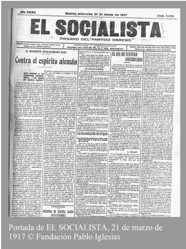
Portada de EL SOCIALISTA, 21 de marzo de 1917