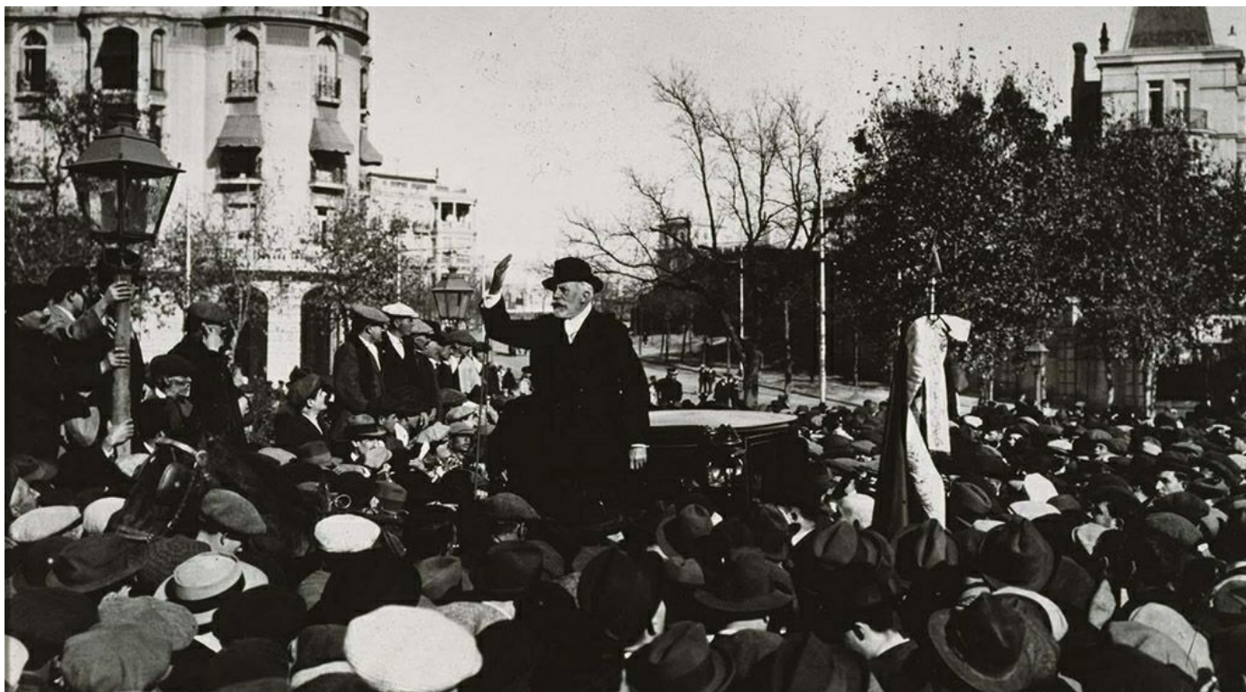
Mitin callejero de Pablo Iglesias